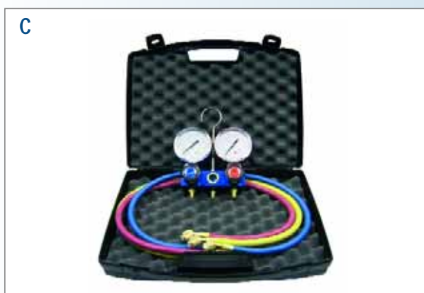
Gruppo manometrico a 2 vie, "Pulse-Free", con manometri Ø 80 mm 2-way manifolds, "Pulse-Free", with Ø 80 mm pressure gauges