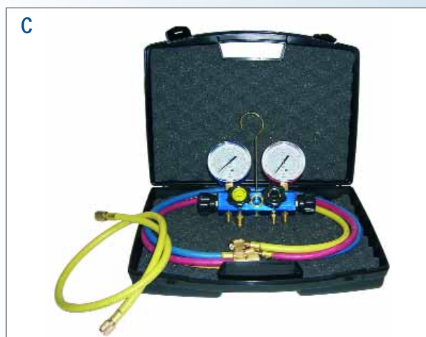
Gruppo manometrico a 4 vie, "Pulse-Free", con manometri Ø 80 mm 4-way manifolds, "Pulse-Free", with Ø 80 mm pressure gauges